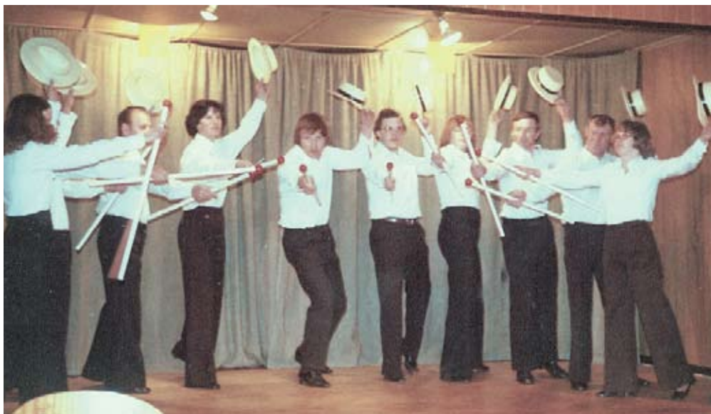
Den første af de senere landskendte "Sønderborg-revyer" blev startet af amatørskuespillere fra LSGs revy.

(I de følgende udgaver af Lokaltidningen kan man læse om LSGs profiler og højdepunkter)