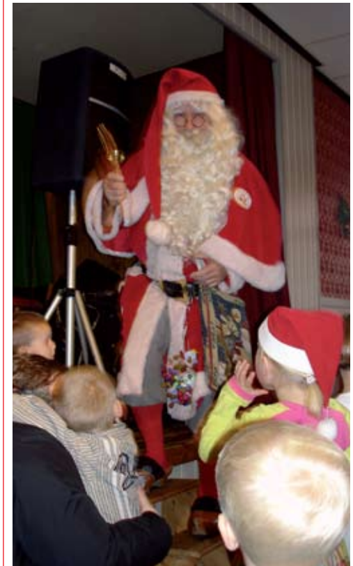
Der er musik, sanglege, dans om juletræet og godteposer til børnene, når Skovby Gamle Skoles Juletræsforening holder julefest den 16. december. Husk tilmelding