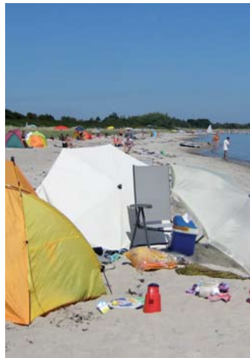
Sommerdag på Kærneland