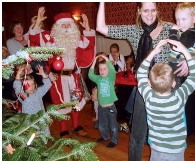
Juletræsfest på Skovby Kro 2008

I november havde Lysabild's 7 dagplejere besøg af Gymnastik Karavanen. Der var masser af inspiration til nye aktiviteter, når dagplejere og børn én gang om måneden mødes i skolens gymnastiksal til motion og sjov. Vi dagplejere fik nye idéer til sang og bevægelse - ja selv et simpelt dynebetræk kan give meget sjov!