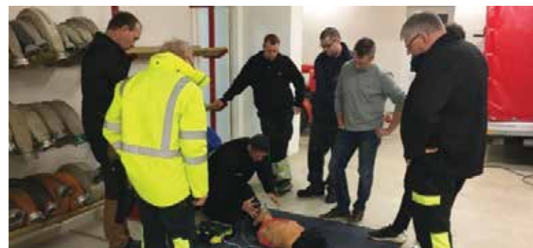
Opfriskning af udvidet førstehjælp ved dygtige instruktører fra B&R Sønderborg.