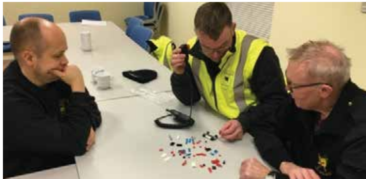
Vi træner radiokommunikation ved hjælp af LEGO klodser.

De forskellige iværksatte tiltag skal tilsiere forsats drift af brandstationen, så vi ikke bidrager med smitte til borgere i risikogrupperne. Bestyrelsen og holdledergruppen afholder alle møder ved hjælp af Skype-møder via computeren.